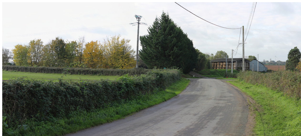
Photographie de l'état initial à 50°